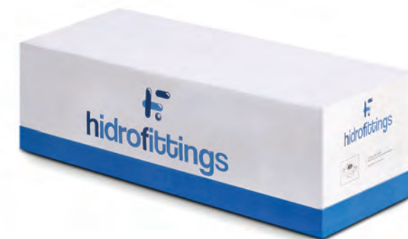
Ilustración del producto.